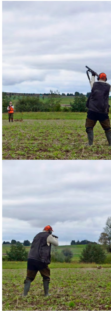
Så här gör man när en hare smiter igenom skyttelinjen.