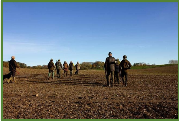
Militärisk disciplin när skyttarna går ut.