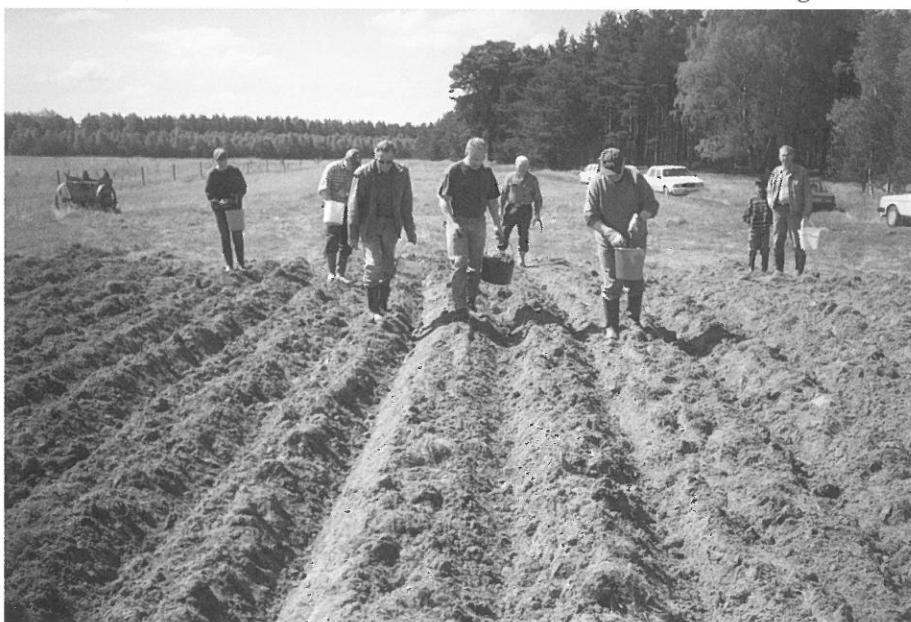
Potatisen kommer i jorden med hjälp av flitiga medarbetare.