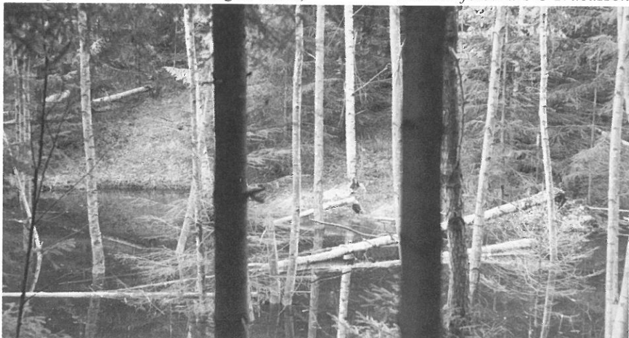
Skottgluggarna är ganska begränsade vid å-kanten