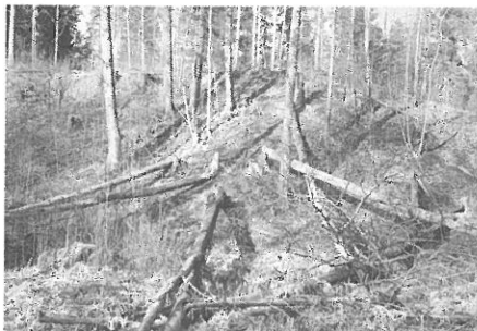
Även grova träd falls. Asp är favoriten

Åter i friluftsgården blev det en dusch och frukost innan våra värdar anlände. De beklagade att vi fått fälla någon bäver,