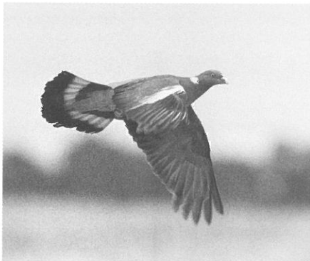
Ringduvan är ett i alla stycken fullödigt jaktobjekt som inte utnyttjas till fullo av svenska jägare.

En egenskap hos ringduvan som vi nog inte alltid tänker på, är att fågeln är tillräckligt stor för att bli en rejäl portion på tallriken. Detta är faktiskt väldigt ovanligt för duvor. Jag vet inte om det finns någon större duva över huvud taget, jag har i alla fall aldrig hört talas om någon. När till exempel nordamerikanska jägare ger sig ut på duvjakt, får de hålla till godo med betydligt mindre fåglar och själv är jag