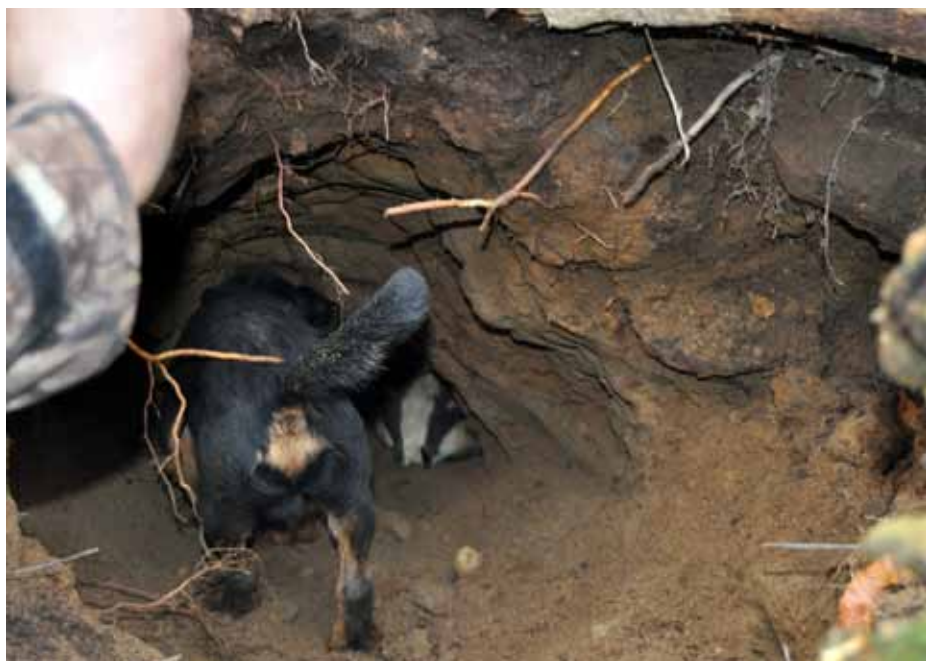
Grävling i grytet och unghunden har fått kontakt!