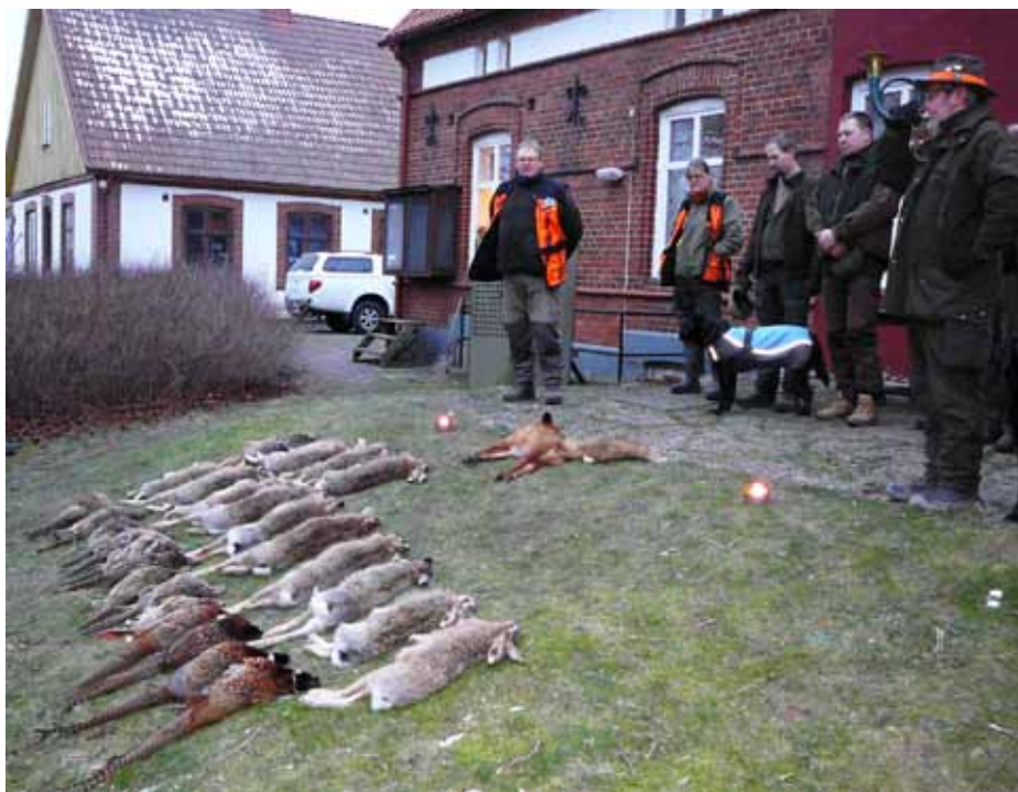
En fin parad efter säsongens sista småviltjakt bättrade upp statistiken för hare. Liksom flera gånger tidigare kunde vi glädja oss åt att det även låg en räv på parad.

Vi kommer även tills nästa säsong att satsa på utsättningsklara fasaner.