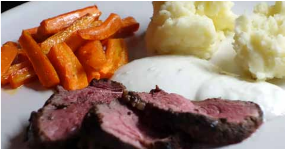
Härligt kryddig fransyska av hjort med morötter och potatismos.

Skär upp skivor av fransyskan och servera potatismoset, morötterna och limsåsen till.