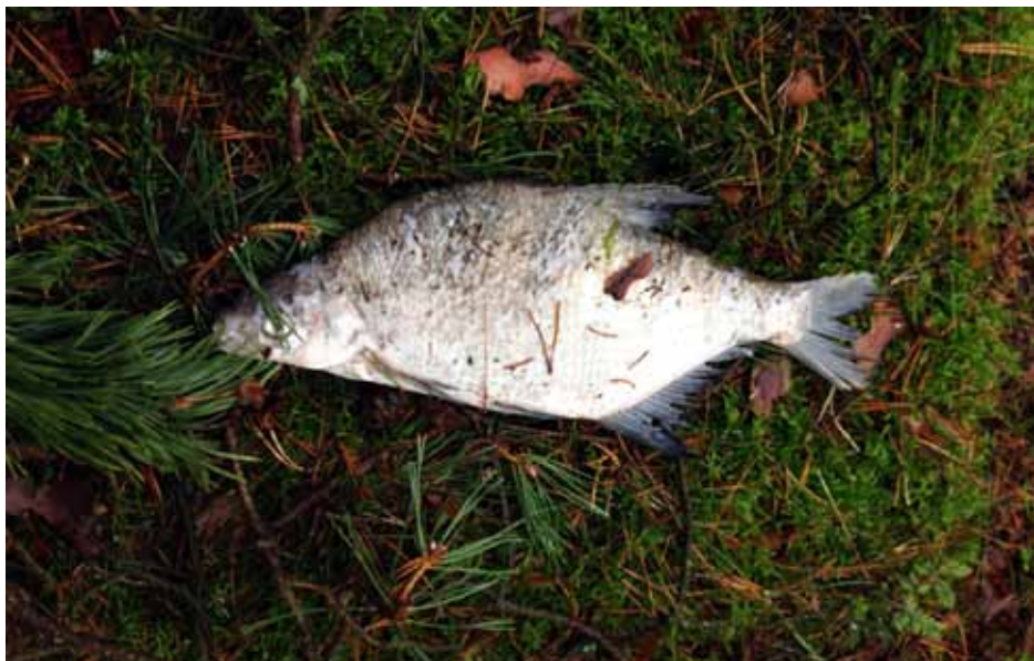
Det dunsade till och i mossan låg en – braxen!