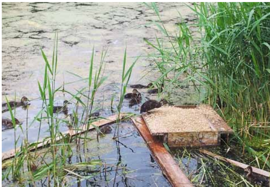
De utsatta änderna etablerade sig fint i dammarna och lockade till sig åtskilliga artfränder.

Inför sista jakten så fick vi äntligen kallt väder vilket möjliggjorde drev på hare. Vi hade en bra jakt och sköt nästan en tredjedel av årets totala avskjutning. Nedgången på hare som man upplever på många andra ställen i Skåne, främst då Söderslätt och Österlen, är något vi inte tycker oss se på Malmöområdet och vilket bekräftas av andra som jagar i samma område.