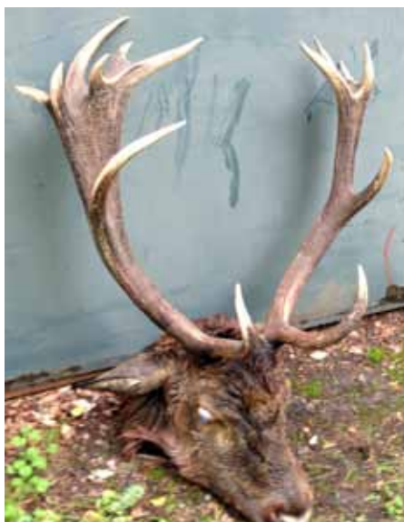
Den fina trofén togs tillvara och kommer att hängas på Kvarnbygården.