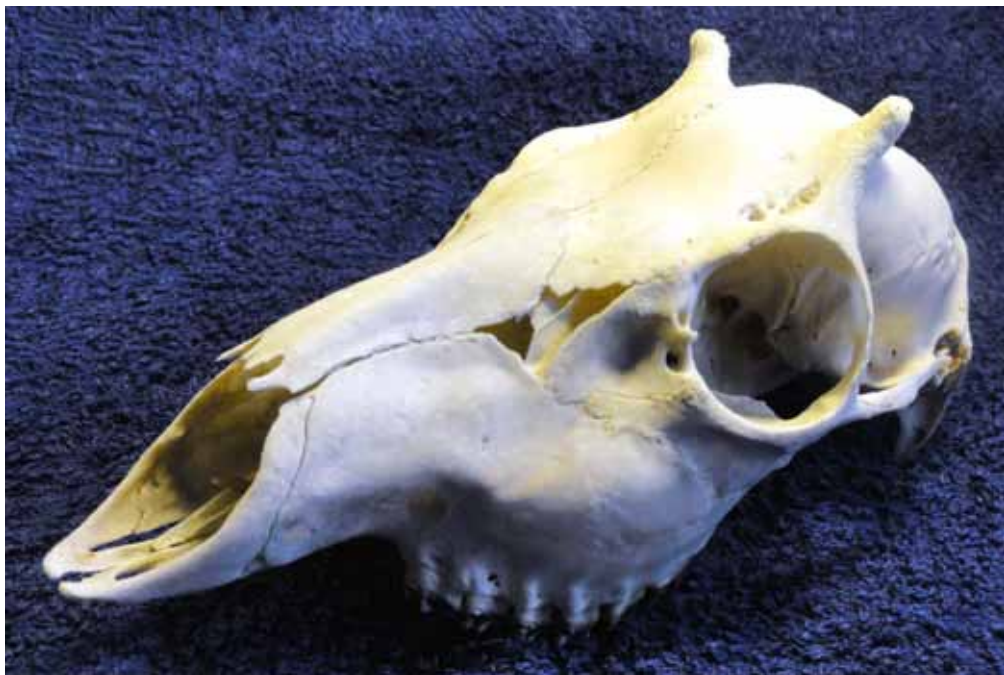
På den renkokta skallen ser man tydligt de båda hornen.

När han såg den andra änden av djuret var det ett typiskt hondjur med en pensel i akterspeglern. Passningen fick avgöra och det visade sig vara ett litet smaldjur.