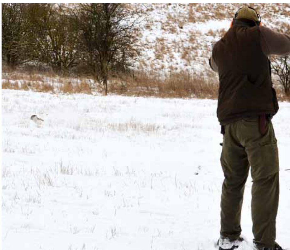
Korta håll och snabba kaniner utmanar skjutskickligheten. Här gick det bra.