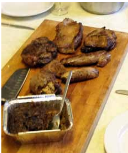
Många delar av vildsvinet för deltagarna att träna på

MASSOR AV KURSER! MVF erbjuder medlemmarna en mängd kurser och utbildningar. Kolla in utbudet på hemsidan, mvf.nu .