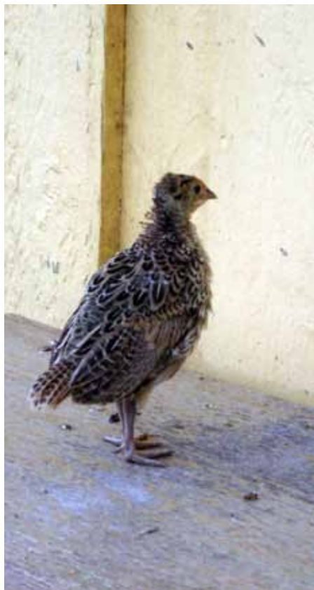
Fasanckicklingar är ömtåliga små varelser som kräver mycket omsorg.