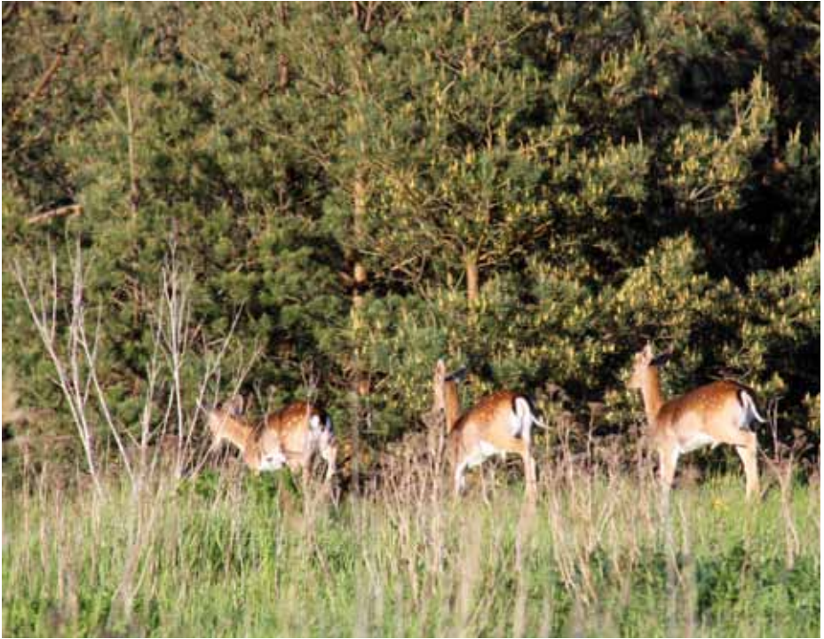
Dovviltet har ökat på vårt område i Vomb och vi ser ofta flockar utspridda över hela jaktområdet.

uppfattningen bland viltvårdarna är att det varit en stadig ökning, säger Peter Jonzon. Exakt hur många dovsvilt som håller till på området är naturligtvis väldigt svårt att säga. För även om dovsviltet är betydligt mera platstroget än kronviltet, så vandrar en del mellan våra och angränsande jaktmarker. Det gäller framförallt hjortarna, men även hondjuren kan vandra över gränserna.