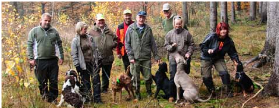
Hela gänget samlat i den härliga höstskogen.

På sträcka 5, nära spårslutet spårar han allt