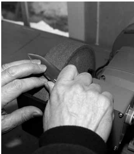
Knivslipning står på programmet på Kvarnbygården den 10 mars.