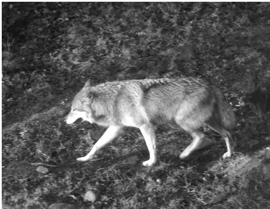
En fin möjlighet för oss skåningar att studera vargar försvann när ledningen för Skånes djurpark såg sig nödsakad att avliva hela varflocken.

planera för nästa. Artiklarna i Svensk Jakt om "Tio jakter du bör uppleva innan du dör" visar vilken fantastisk bredd och urval det finns inom jakten. För egen del kan jag dock inte acceptera att man klassar det som jakt att skjuta 596 duvor på en dag, oavsett var detta sker i världen, eller med så lite som 950 skott.