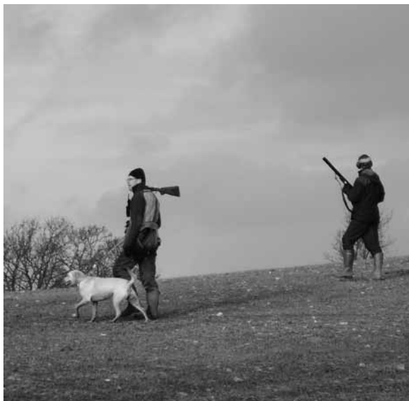
Som viltvårdare får man vara beredd att hjälpa till vid jakterna på området.