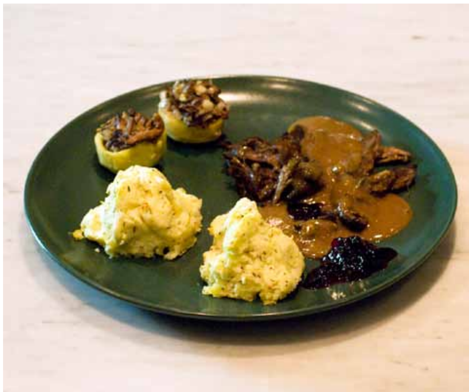
Visst ser det läckert ut, med kantarellerna i kronärtskockor, gratinerat potatismos med timjansmak och så förstås de läckra harstekarna.