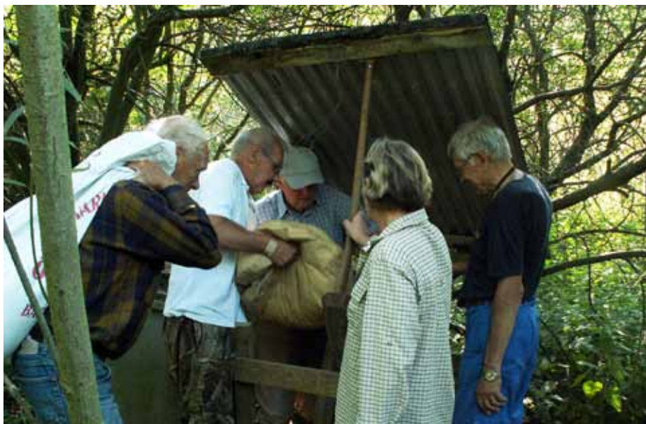
Att vara viltvårdare innebär ett kontinuerligt arbete, bland annat med utfodring.

bland andra jakträttsinnehavares, får vi räkna med att en hel del rävar söker sig till våra jaktmarker enbart när de söker föda. Antalet kråkor har minskat, vilket återspeglar sig i avskjutningsstatistiken. Vi har dem framför allt kring hästgårdarna där de dras till gödselhögarna. Skator och råkor finns det däremot gott om. Råkorna är ju inget problem för småviltet, men det finns faktiskt de som tror att det är svarta kråkor. Vi har ett par kråkgömslen där vi åtlar till och från, så det skall väl läggas ner lite fler kråkfåglar innan säsongen är över. Jakten står för en mycket liten del av dödligheten på småvilt och påverkar därför populationen i liten grad, men det är ändå en faktor att ta hänsyn till. Vi vill ju ha kvar tillräckligt med vilt i våra marker även efter jaktsäsongen så att vi behåller en livskraftig stam. Så när vi tagit ut vad vi bedömer att en mark kan bära får det vara nog på den marken.