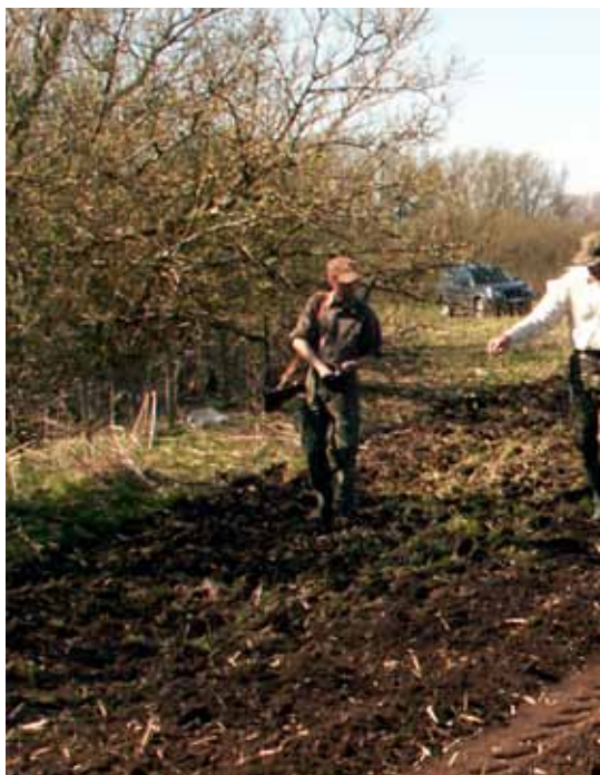
Sådd av olika grödor kan ge viltet både skydd och

Framgångsrik viltvård bygger i stor utsträckning på att man arbetar med viltets livsmiljöer, och ofta kan man uppnå större vinster för viltet genom anpassad markanvändning än genom att enbart arbeta med mer traditionella viltvårdsåtgärder. Markägare och jakträttshavare har enligt jaktlagen ett gemensamt ansvar för att det bedriva god viltvård på en mark.