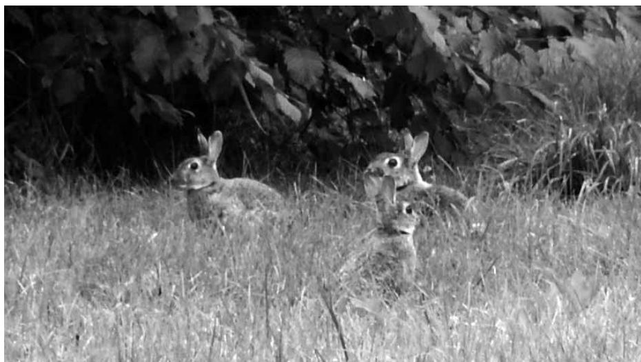
Vildkaninerna ökar i Malmö och det avspeglas i statistiken.