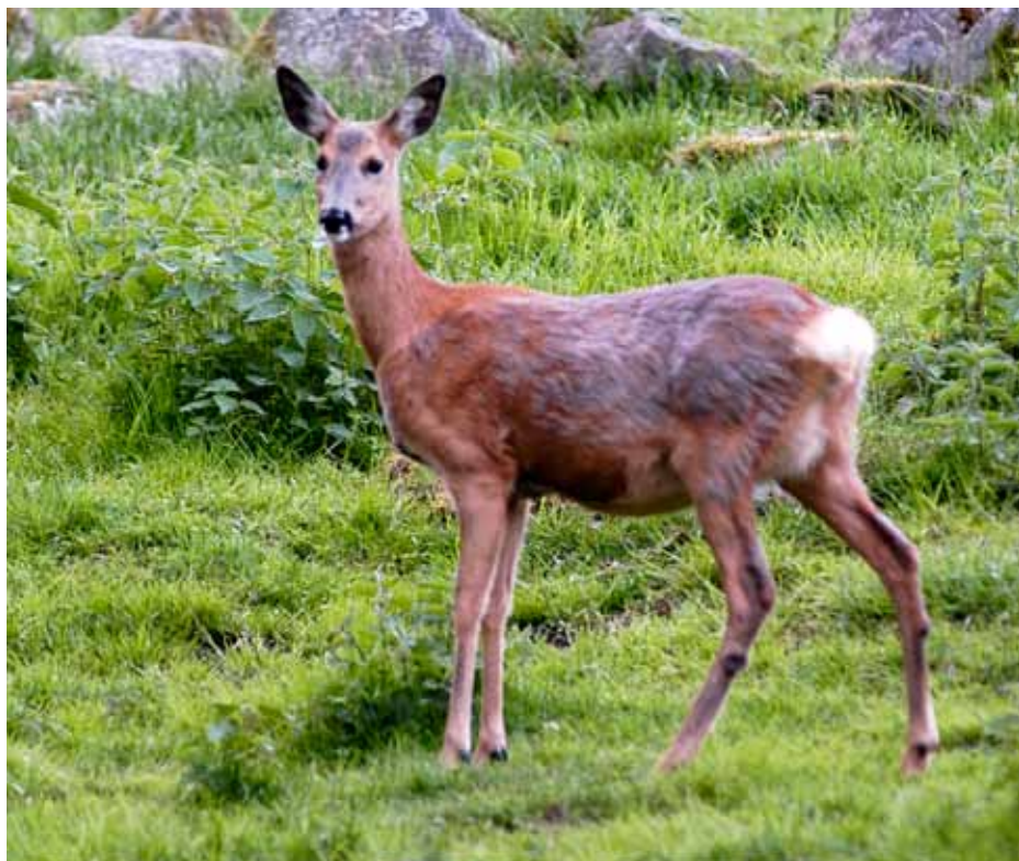
Rådjursstammen har återhämtat sig starkt, efter en framgångsrik kampanj för att minska antalet rävar.

Förutom de uppräknade klövviltarterna jagar vi predatorer; räv, grävling och