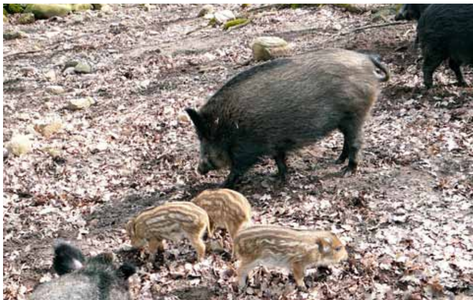
Vildsvinen är produktiva och kommer säkert att bli ett allt viktigare viltslag i Vomb. Men dom är svåra att jaga och än så länge skjuter vi inte så många.