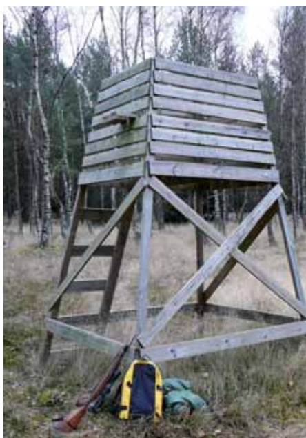
Vomb-området har många välbyggda jaktorn som har plats för två personer.

Alla föreningens medlemmar är välkomna. Nybörjare tas mycket väl omhand och får hjälp både med det praktiska kring jakten och med att komma in i gruppen.