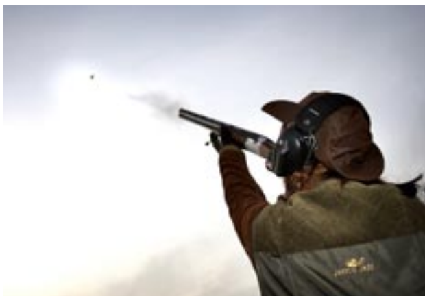
Där kommer det en and – pang, men det blev bom den här gången.