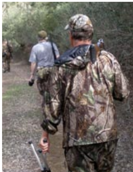
I Tunisien får man bara jaga med vanlig hagelbössa, så det var slug som gällde.