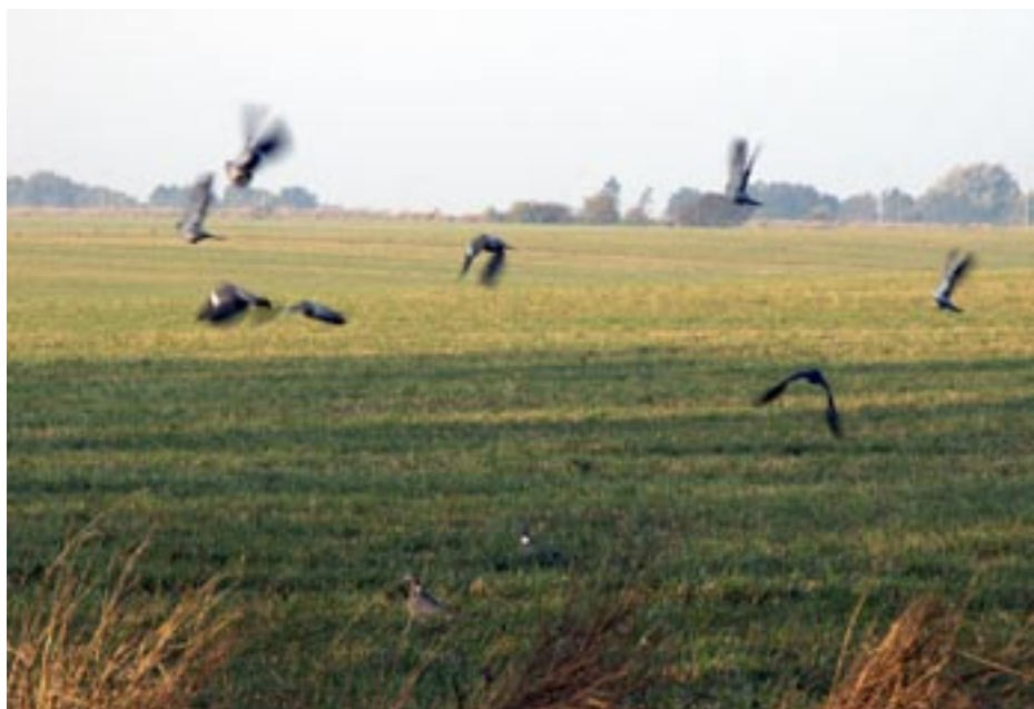
Massor av duvor i luften! Så såg det ut på våra Malmömarker under stora delar av september.