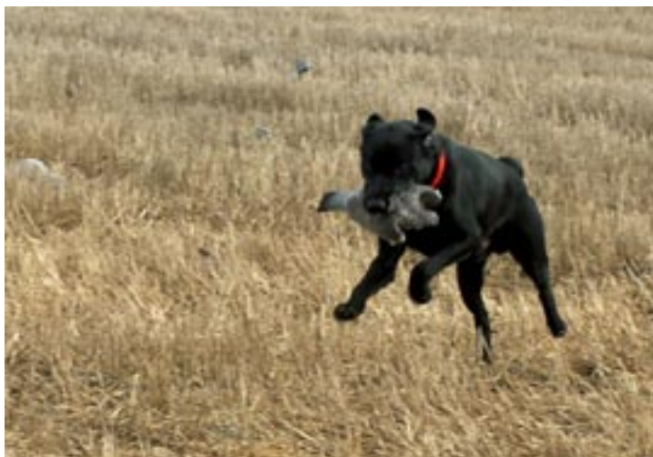
Full fart in med en ringduva.