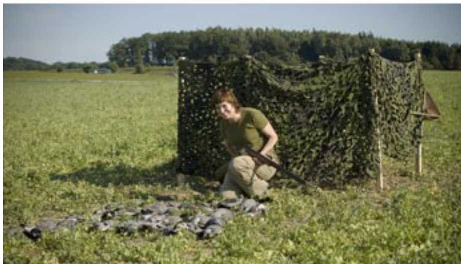
Sitter man på rätt ställe kan det bli många duvor en lyckad dag.

För det tredje behöver hagelskyttet stämma. En målmedveten ringduva i medvind är på grund av den höga hastigheten (över 70 km/h) ett tämligen utmanande mål, liksom de duvor som krängande och vinklande försöker gå ned bland bulvanerna alternativt kastar vid åsynen av en illa kamouflerad jägare. Under en bra duvjakt kan det gå åt ansemliga mängder ammunition, men inte sällan blir man förvånad när man jämför antalet fällda fåglar med den ihopsamlade högen tomhylsor (vanligtvis betydligt fler än antalet fåglar). Personligen brukar jag skjuta med små hagel, lätta laddningar och relativt öppna choker, men som vanligt är det viktigaste att man använder en bössa som man är väl överens med. En annan viktig faktor är naturligtvis att hålla sig inom rimliga hagelhåll (sitter man ”rätt” och har en effektiv bulvanbild behöver skjutavståndet sällan bli särskilt långt). Med tanke på den korta jakttiden på