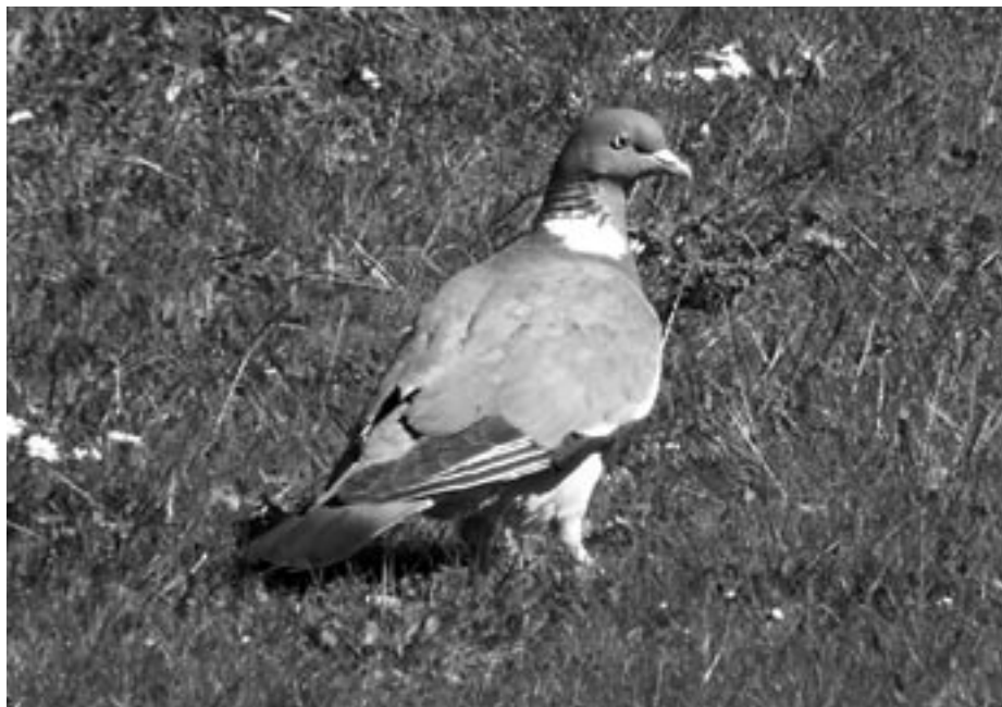
Den kraftiga ringduvan har rejäla bröstmuskler som utgör en härlig grund för en lyckad måltid.

Serveras med klyftpotatis eller grönsaker som ugnrostas.