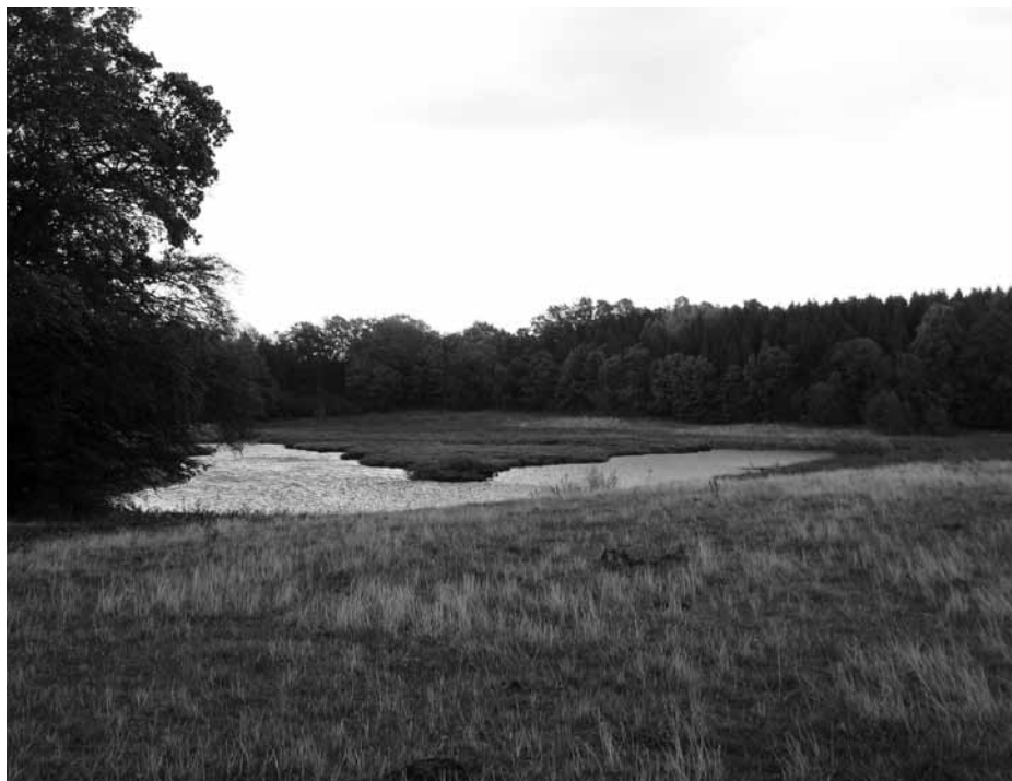
Sturup-området innehåller många småvatten, vilket betyder att det är gott om änder och gäss.