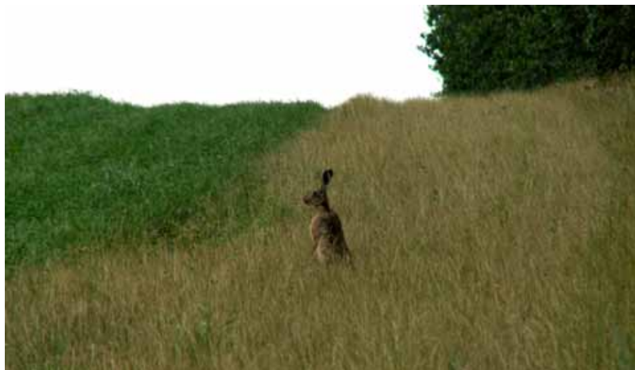
Årets första småviltjakt på Sturp bjöd på många skottillfällen på hare.