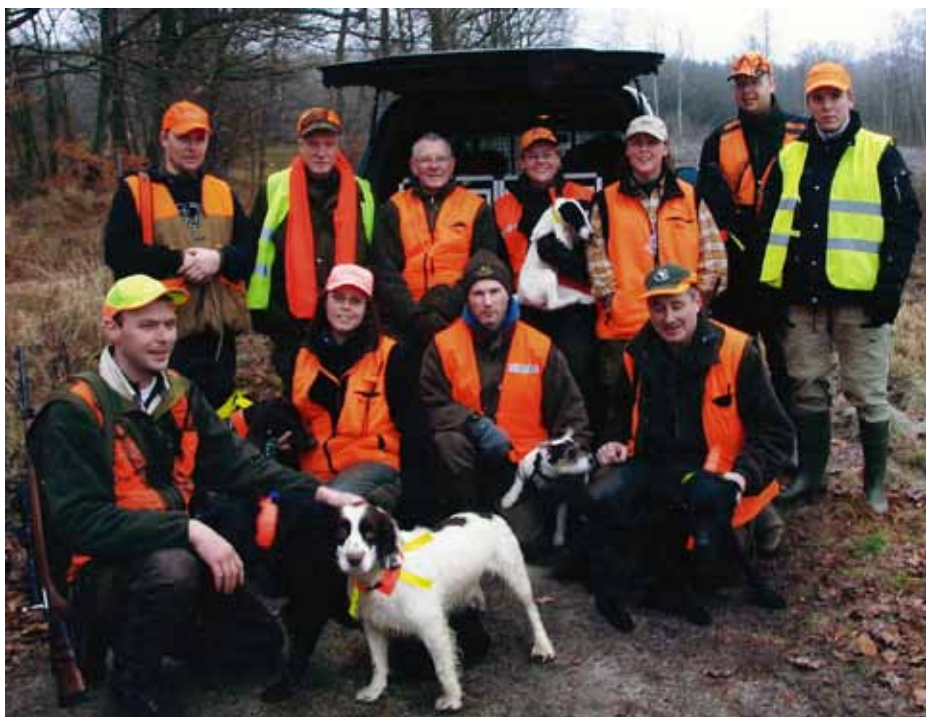
Verksamheten på våra jaktområden bygger på en omfattande ideell insats. Här är dreyfolk och funktionärer samlade för klövviltjakt på Sturup.