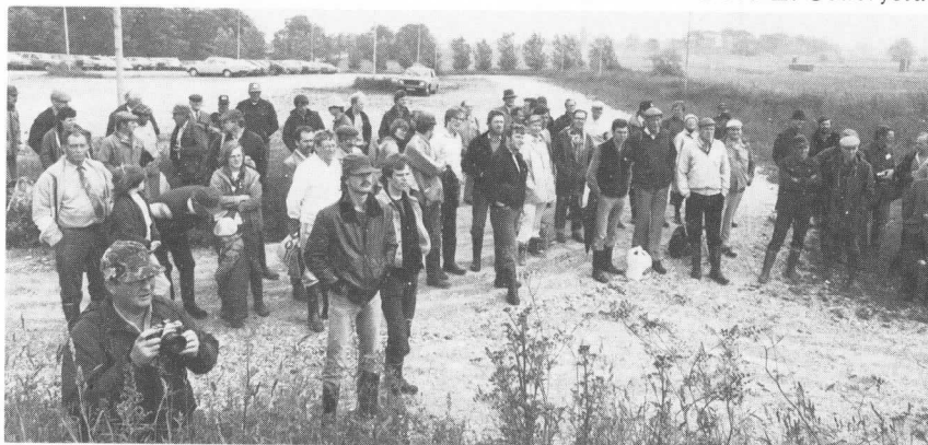
Många skånejägare hade mött upp till sommaringet i Malmö.