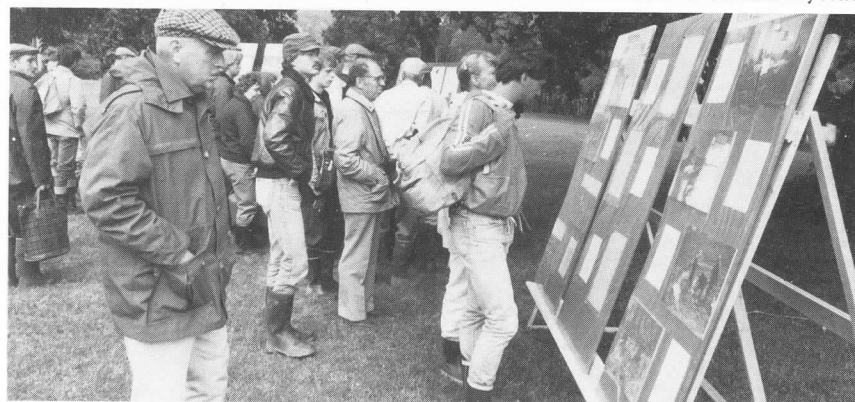
Bildskärmar med presentation av MVF verksamhet.