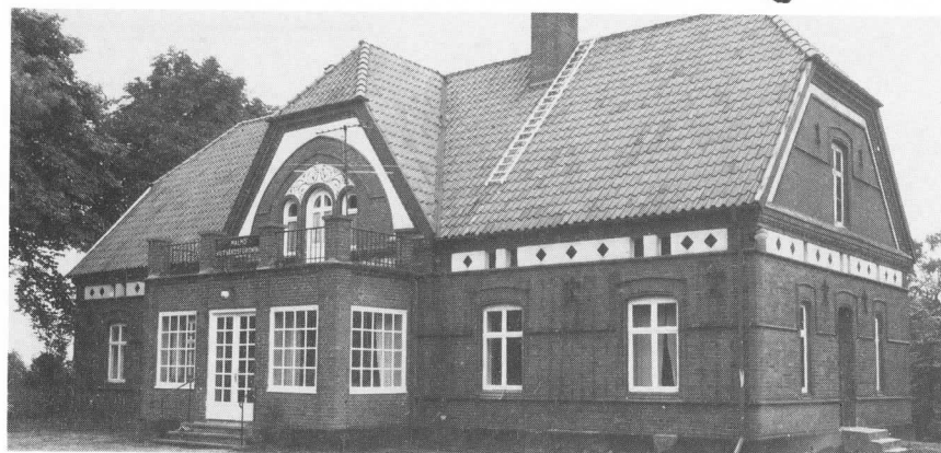
MVF föreningsgård — Kvarnbygården.